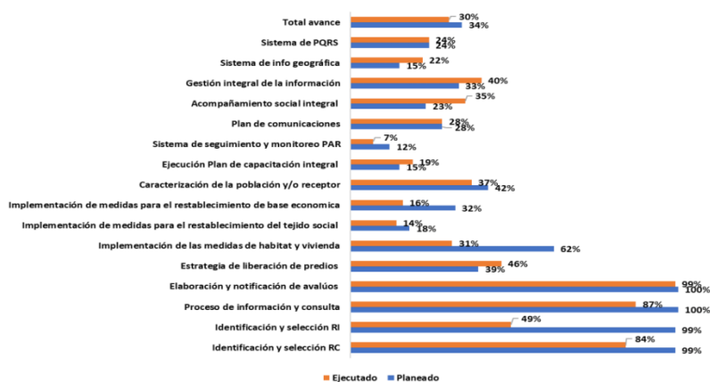
Figura. Actividades programadas y ejecutadas durante el cuarto trimestre del 2020 para el cumplimiento del PAR de El Hatillo

Fuente: Informe trimestral IV del año 2020 con radicado 2021002443-1-000 del 8 de enero de 2021