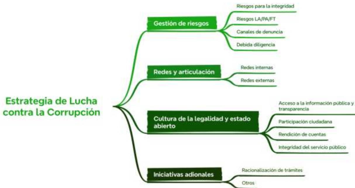
Imagen 3. Estructura del PTEP

Siguiendo lo establecido por el Decreto 1122 del 2024, la ANLA adopta en su PTEP la siguiente estructura: