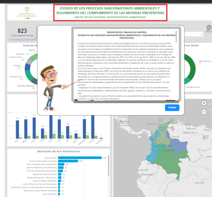
Imagen 3. Consulta de Expedientes Sancionatorios Ambientales