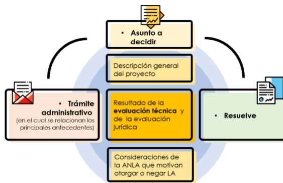
Figura 1. Estructura plantilla nueva Acto Administrativo de Evaluación Ambiental

En tal sentido, en cabeza de la Oficina Asesora Jurídica - OAJ con la participación de la Dirección ANLA y las Subdirecciones de Instrumentos, Permisos y Trámites Ambientales – SIPTA, Mecanismos de Participación Ciudadana – SMPCA y de Evaluación de Licencias Ambientales – SELA, se trabajó en el diseño de la plantilla del AAE durante sesiones semanales entre agosto y octubre de 2021, del cual se obtuvo una plantilla que recoge los aspectos necesarios para el objetivo a lograr con el nuevo concepto, lo cual se resume en la siguiente figura: