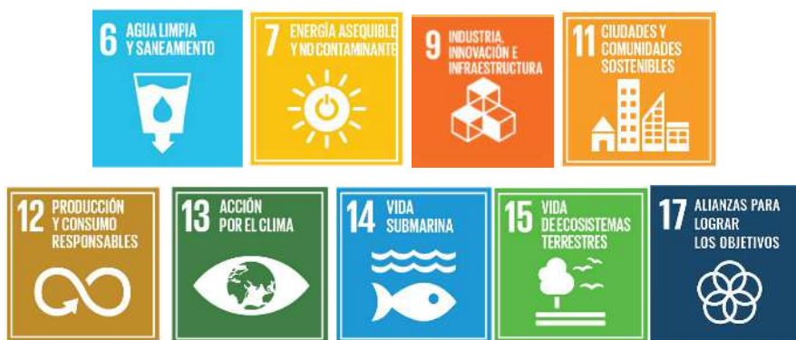
Figura 6. Objetivos de Desarrollo Sostenible – ODS asociados al quehacer de la ANLA