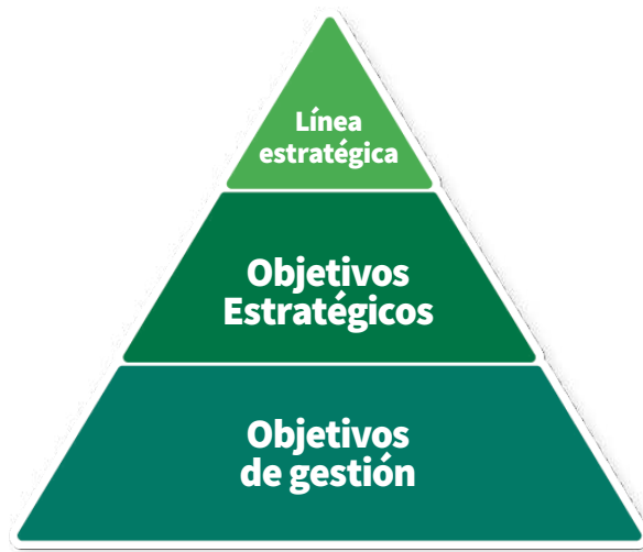
Figura 4. Estrategia jerarquizada del Plan

Se definieron cuatro (4) líneas estratégicas para este plan, las cuales se encuentran interrelacionadas y se proyectaron con el propósito de establecer el direccionamiento de la entidad para el cumplimiento de las apuestas de la autoridad en el horizonte proyectado. Para el logro de dichas líneas, se establecieron objetivos estratégicos para cada una de ellas, objetivos de gestión e indicadores. A continuación, se presenta la estructura jerarquizada del plan: