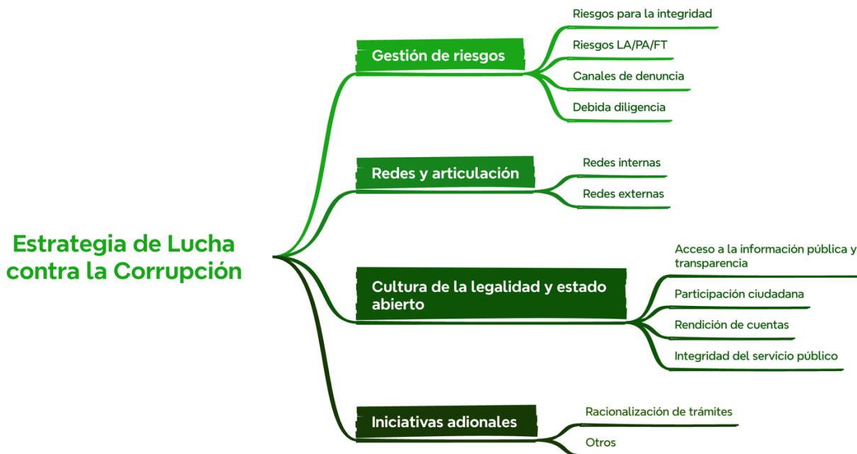
Imagen 3. Estructura del PTEP

Siguiendo lo establecido por el Decreto 1122 del 2024, la ANLA adopta en su PTEP la siguiente estructura: