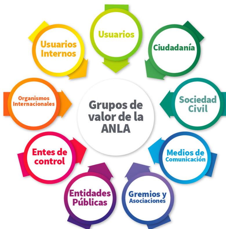
Imagen 1. Partes Interesadas (Grupo de Valor)

Los grupos de interés (grupos de valor) identificados por la entidad son los siguientes: