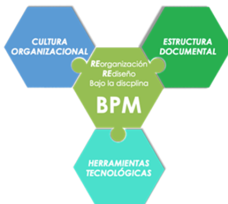
Fuente: Documento BPM Oficina Asesora de Planeación ANLA

Como áreas integradoras y promotoras de la estrategia de implementación de la disciplina BPM en la entidad, se encuentra la Oficina Asesora de planeación (OAP) como líder funcional de BPM y la Oficina de Tecnologías de la Información (OTI) como Líder técnico de BPMS interviniendo en los aspectos respectivos a su especialidad.