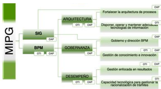
Fuente: Documento BPM Oficina Asesora de Planeación ANLA

Nota: El SIG y BPM se encuentran enmarcados en el Modelo Integrado de Planeación y Gestión, siendo herramientas que implementa la ANLA para gestionar los procesos al interior y exterior de la misma, priorizando el cumplimiento de las directrices del MIPG bajo los principios de integridad y legalidad, como motor de la generación de resultados de la administración pública.