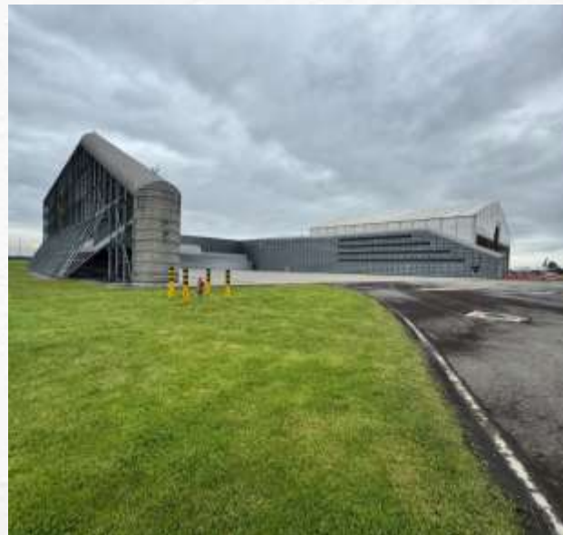
Recinto de Prueba de Motores - RPM