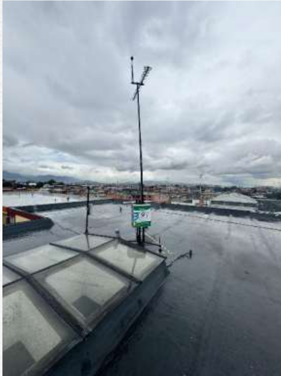
Estación de Monitoreo de Ruido Inteligente - EMRI

Nombre del proyecto: Ejecución de las obras de Construcción y Operación de la segunda pista y/o ampliación del Aeropuerto Internacional El Dorado.