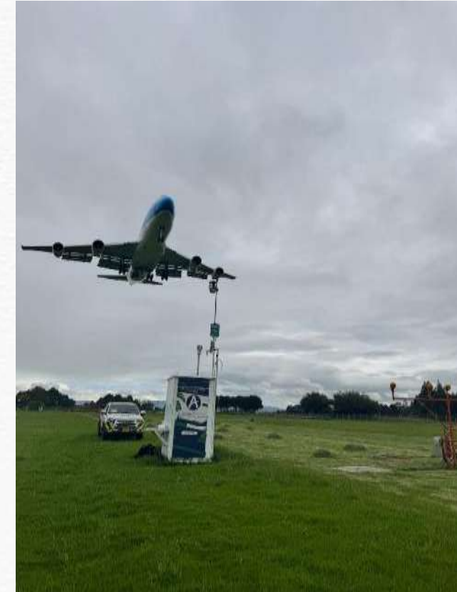
Estación de Monitoreo de Calidad de Aire