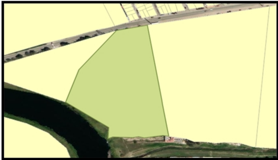
Imagen 2. Localización del sitio objeto de verificación