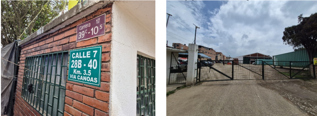
visita realizada el día 24 de febrero de 2026