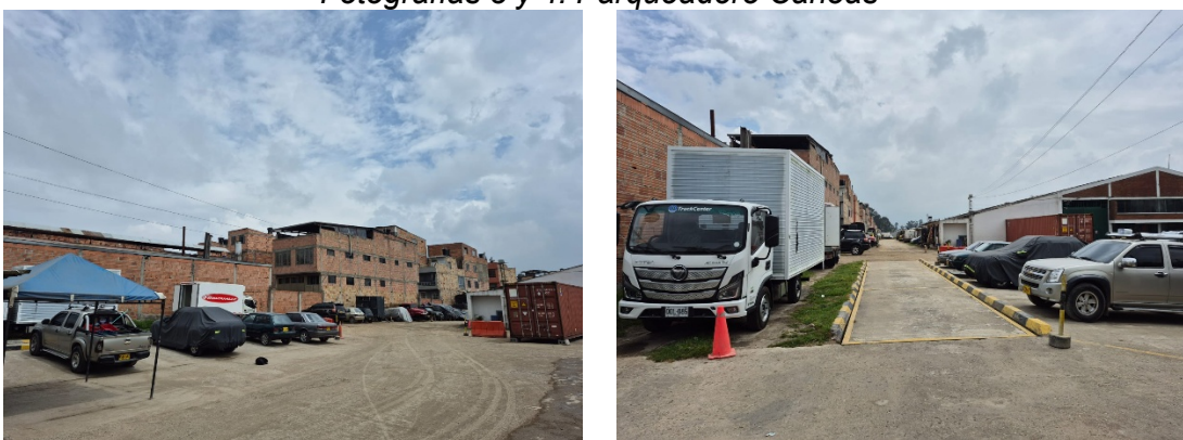
visita realizada el día 24 de febrero de 2026