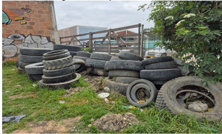
Fotografía 6. Disposición de llantas