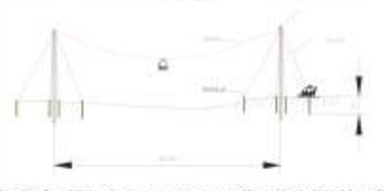
Figura 10-6 Diseño y estructura del Sistema de transporte con teleférico y carreta (Tubo)

Los sitios de anclaje en todos los casos en que sea necesario se ubicarán dentro del área de influencia del proyecto, siguiendo además los indicaciones dispuestas en la Acción de Manejo Ambiental A-01-01-01 F04 Manejo para los sitios de uso temporal, siendo pertinente aclarar que no se requiere del uso, aprovechamiento y/o afectación de recursos naturales. Dichos sitios de instalación deberán ser autorizados y aprobados previamente por la Interventoría del Proyecto. La ubicación de estas edificaciones y la localización exacta de los sitios temporales para la instalación de los teleféricos, serán debidamente reportadas y soportadas en los informes de Cumplimiento Ambiental – ICA de la obra de construcción.