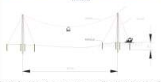
Figura 10-6 Diseño y estructura del Sistema de transporte con teleférico y carreta (TARDEA)

Los sitios de anclaje en todos los casos en que sea necesario se ubicarán dentro del área de influencia del proyecto, siguiendo además los indicaciones dispuestas en la Acción de Manejo Ambiental A-01-01-01 F04 Manejo para los sitios de uso temporal, siendo pertinente aclarar que no se requiere del uso, aprovechamiento y/o afectación de recursos naturales. Dichos sitios de instalación deberán ser autorizados y aprobados previamente por la Interventoría del Proyecto. La ubicación de estas edificaciones y la localización exacta de los sitios temporales para la instalación de los teleféricos, serán debidamente reportadas y soportadas en los informes de Cumplimiento Ambiental – ICA de la etapa de construcción.