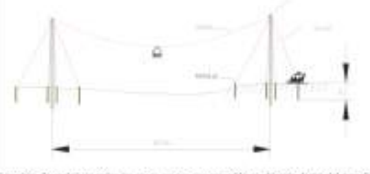
Figura 10-6 Diseño y estructura del Sistema de transporte con teleférico y carreta (TARDEA)

Los sitios de anclaje en todos los casos en que sea necesario se ubicarán dentro del área de influencia del proyecto, siguiendo además los indicaciones dispuestas en la Acción de Manejo Ambiental A-01-01-01 F04 Manejo para los sitios de uso temporal, siendo pertinente aclarar que no se requerirá del uso, aprovechamiento y/o explotación de recursos naturales. Dichos sitios de instalación deberán ser autorizados y aprobados previamente por la Interventoría del Proyecto. La ubicación de estas edificaciones y la localización exacta de los sitios temporales para la instalación de los teleféricos, serán debidamente reportadas y soportadas en los informes de Cumplimiento Ambiental – ICA de la etapa de construcción.