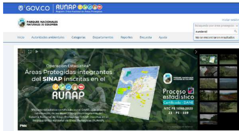
Figura 1 Consulta Registro Único Nacional de Áreas Protegidas -RUNAP

De igual manera, esta consulta puede realizarse en la página del Registro Único Nacional de Áreas Protegidas -RUNAP, en la cual se evidencia que no existe información referente a dicha Reserva de la Sociedad Civil: