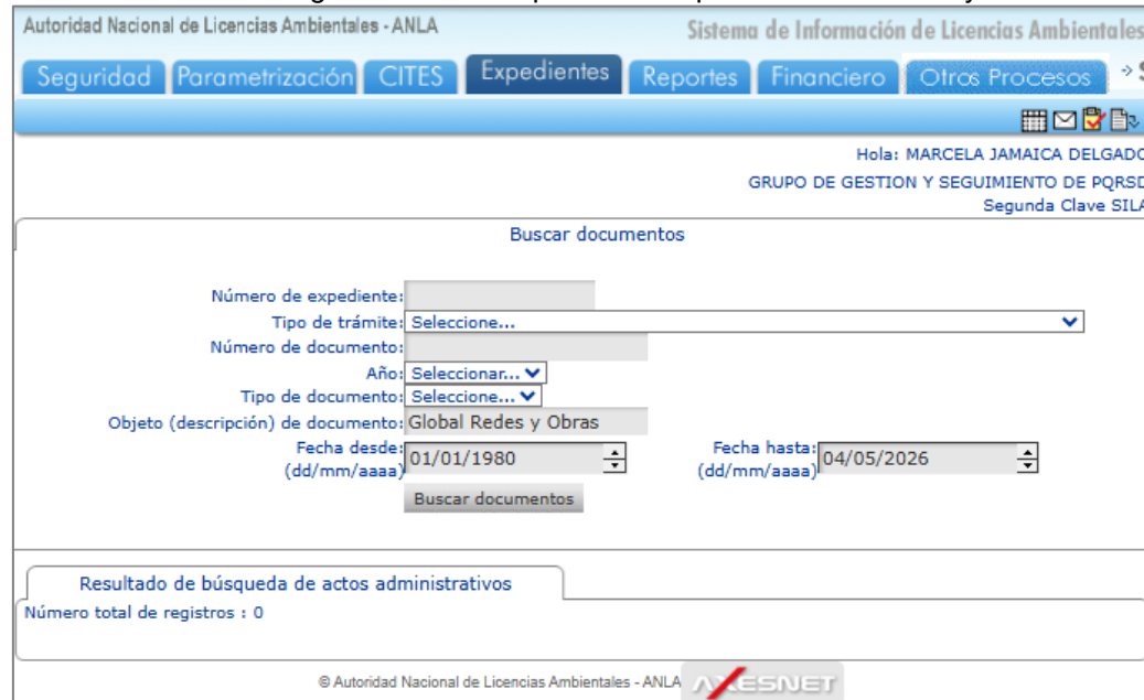
Figura 1. No se encuentra registros al buscar por de la empresa Global Redes y Obras S.A.S E.S.P.