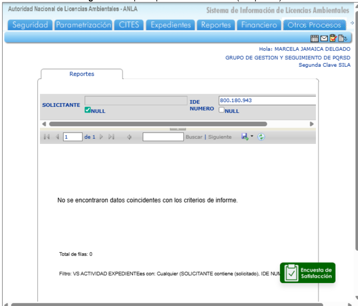
Figura 3. Búsqueda por el número del NIT (con puntos)