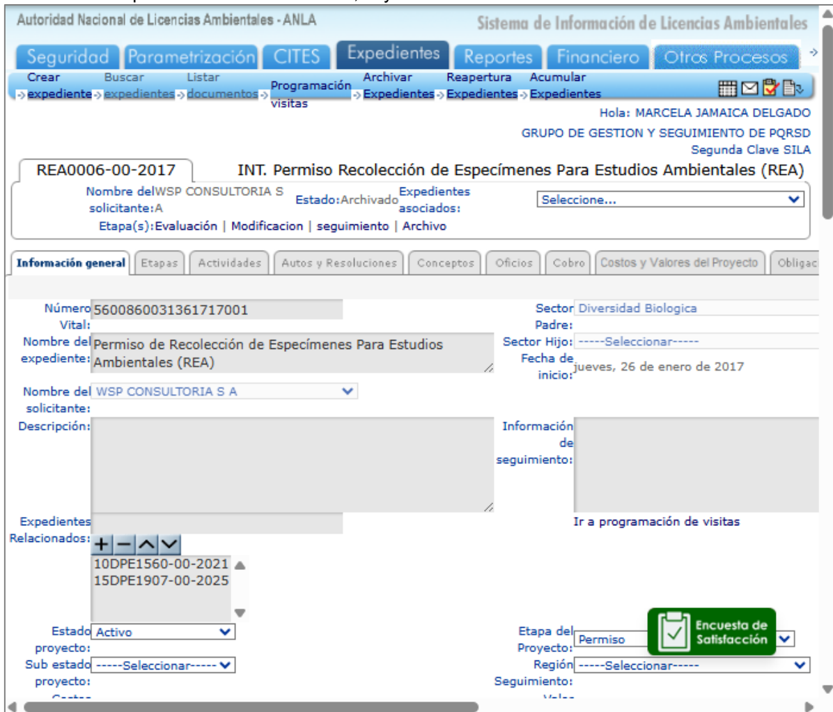
Figura 2. Expediente REA0006-00-2017 corresponde a un Permiso de Recolección de Especímenes para Estudios Ambientales, cuyo titular es WSP CONSULTORÍA S.A

Fuente: Sistema de Información de Licencias Ambientales (SILA)