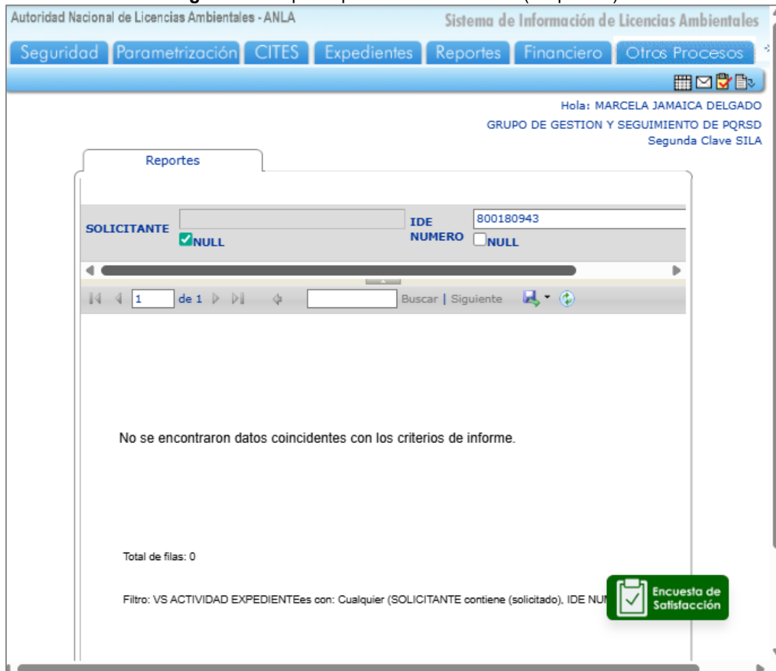
Figura 4. Búsqueda por el número del NIT (sin puntos)