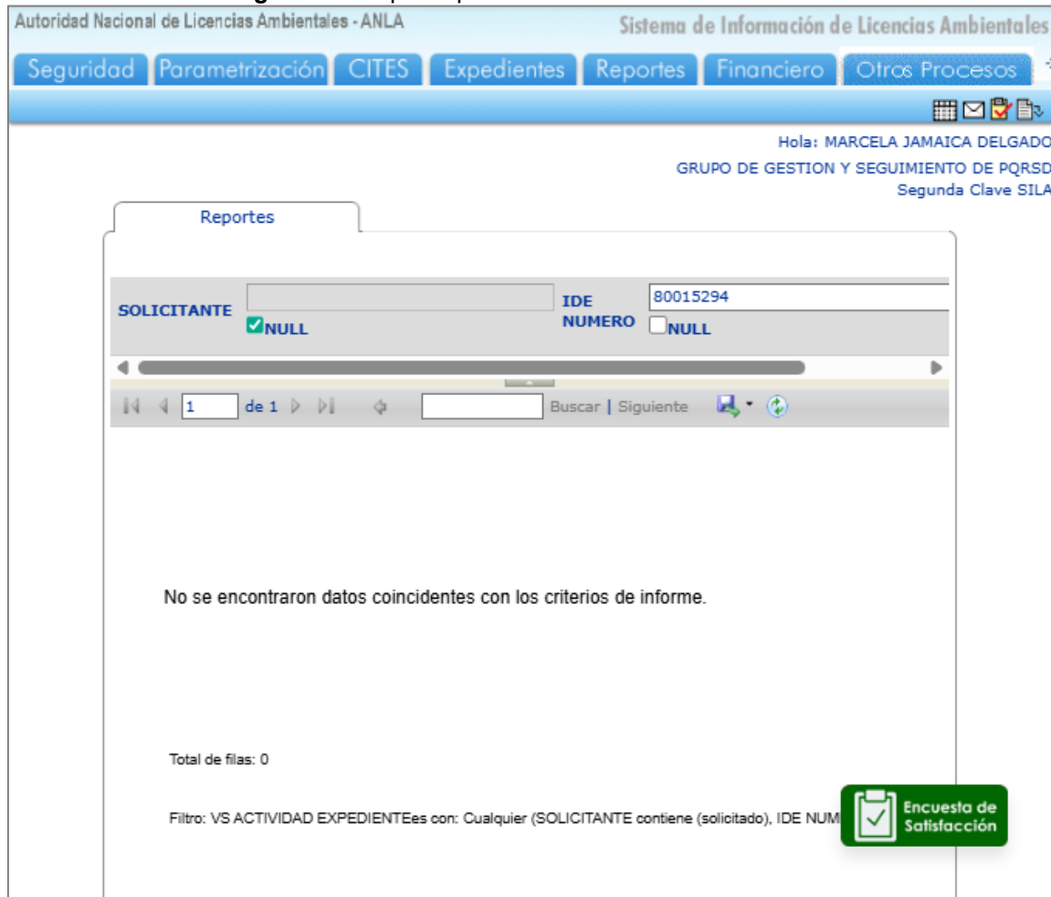
Figura 2. Búsqueda por el número de cédula 80015294