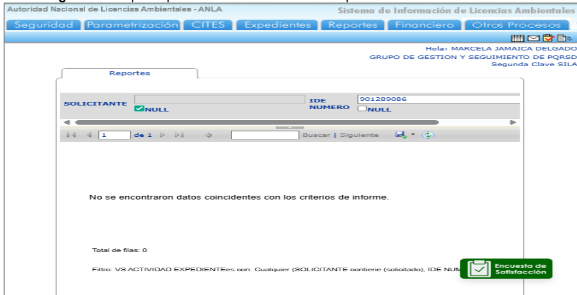
Figura 1. Búsqueda por el NIT 901289086 de la empresa AGARICALES R&R S.A.S.

Fuente: Sistema de Información de Licencias Ambientales (SILA)