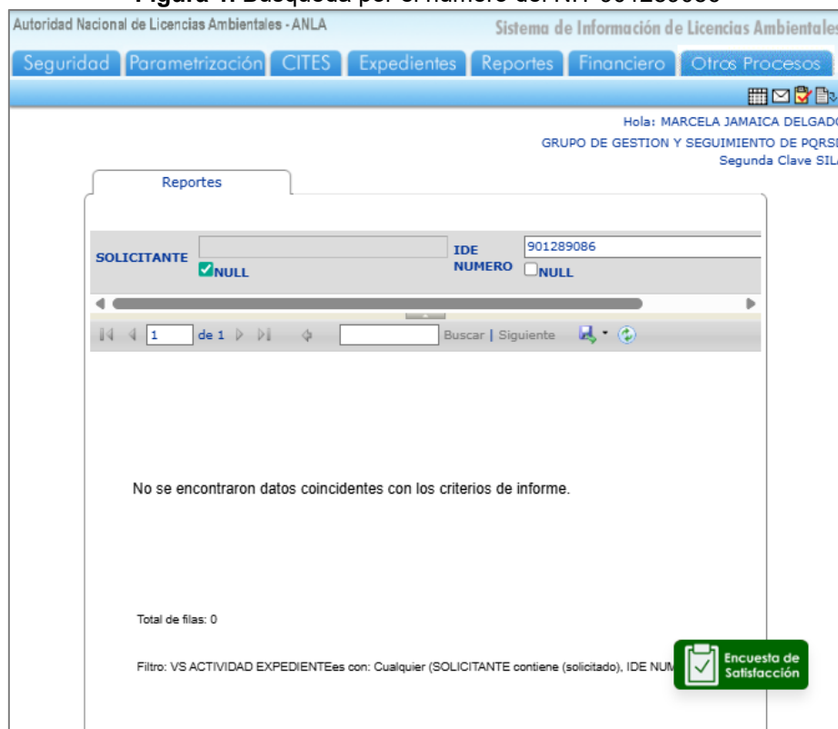
Figura 1. Búsqueda por el número del NIT 901289086

Fuente: Sistema de Información de Licencias Ambientales (SILA)