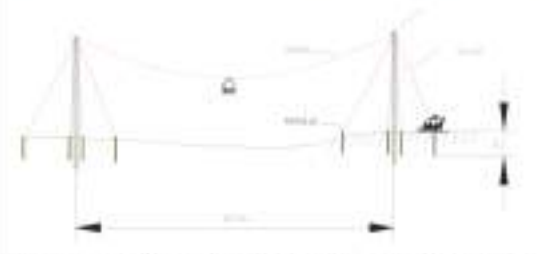
Figura 10-6 Diseño y estructura del Sistema de transporte con teleférico y carreta (TARDEA)

Los sitios de anclaje en todos los casos en que sea necesario se ubicarán dentro del área de influencia del proyecto, siguiendo además los indicaciones dispuestas en la Acción de Manejo Ambiental A-01-01-01 F04 Manejo para los sitios de uso temporal, siendo pertinente aclarar que no se requerirá del uso, aprovechamiento y/o explotación de recursos naturales. Dichos sitios de instalación deberán ser autorizados y aprobados previamente por la Interventoría del Proyecto. La ubicación de estas edificaciones y la localización exacta de los sitios temporales para la instalación de los teleféricos, serán debidamente reportadas y soportadas en los informes de Cumplimiento Ambiental – ICA de la etapa de construcción.