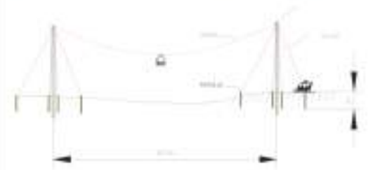
Figura 10-6 Diseño y estructura del Sistema de transporte con teleférico y carreta (TARDEA)

Los sitios de anclaje en todos los casos en que sea necesario se ubicarán dentro del área de influencia del proyecto, siguiendo además los indicadores dispuestos en la Acción de Manejo Ambiental A-01 (E) F04 Manejo para los sitios de uso temporal, siendo pertinente aclarar que no se requiere del uso, aprovechamiento y/o afectación de recursos naturales. Dichos sitios de instalación deberán ser autorizados y aprobados previamente por la Interventoría del Proyecto. La ubicación de estas edificaciones y la localización exacta de los sitios temporales para la instalación de los teleféricos, serán debidamente reportadas y soportadas en los informes de Cumplimiento Ambiental – ICA de la etapa de construcción.